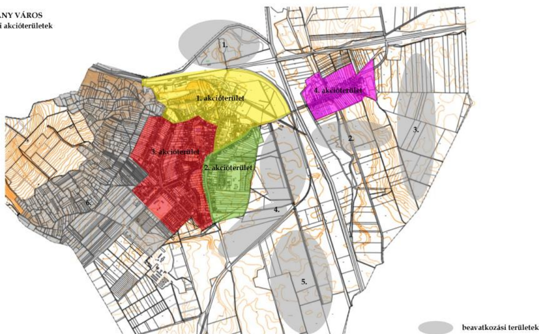
2. ábra: Villány város fejlesztési akcióterületei és külterületi beavatkozási területei

Tervezési, fejlesztési szempontból szükség lenne egy városközponti akcióterületre, melynek valóságos városcentrummá kellene válnia. Ez úgy lenne megoldható, amennyiben a meglévő utcák harántolásával kialakulna egy városmag, melyhez komplex akcióterületi fejlesztési tervet lehetne kapcsolni, egyúttal kivezetni az átmenő forgalmat a főtérről, mely ennek révén betölthetné városszerkezeti, szimbolikus, társadalmi és turisztikai funkcióit. Indokolt, hogy a tervezési eszközök megoldást találjanak erre a problémára. Ezt elősegítheti, hogy a történelmileg kialakult és lényegében ma is változatlan telekszerkezet nagy méretű alulhasznosított centrumközeli területeket tartalmaz.